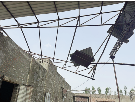
ਮਾਨਸਾ 12 ਜੂਨ (ਗੋਪਾਲ ਅਕਲੀਆ/ਸੰਦੀਪ) - ਬੀਤੀ ਰਾਤ ਬਰਫਾ ਅਤੇ ਆਸ-ਪਾਸ ਦੇ ਇਲਾਕਿਆਂ ਵਿੱਚ ਆਈ ਤੇਜ਼ ਹਨੇਰੀ, ਝੱਖੜ ਅਤੇ ਮੀਂਹ ਨੇ ਭਾਰੀ ਤਬਾਹੀ ਮਚਾ ਦਿੱਤੀ।

ਅਚਾਨਕ ਵਿਗੜੇ ਮੌਸਮ ਕਾਰਨ ਉਦਯੋਗਿਕ ਇਕਾਈਆਂ, ਰਾਈਸ ਮਿੱਲਾਂ, ਕਿਸਾਨਾਂ, ਦੁਕਾਨਾਂ, ਘਰਾਂ ਅਤੇ ਹੋਰ ਵਪਾਰਕ ਅਦਾਰਿਆਂ ਨੂੰ ਵੱਡੇ ਪੱਧਰ 'ਤੇ ਨੁਕਸਾਨ ਪੁੱਜਿਆ ਹੈ। ਤੇਜ਼ ਹਵਾਵਾਂ ਹਵਾਵਾਂ ਕਾਰਨ ਕਈ ਥਾਵਾਂ 'ਤੇ ਟਿੱਕੇ ਡਿੱਗ ਗਏ, ਦਰੱਖਤ ਜੜ੍ਹਾਂ ਸਮੇਤ ਡਿੱਗ ਪਏ ਅਤੇ ਬਿਜਲੀ ਸਪਲਾਈ ਵੀ ਬੁਰੀ ਤਰ੍ਹਾਂ ਪ੍ਰਭਾਵਿਤ ਹੋਈ। ਕੁਦਰਤੀ ਆਫ਼ਤ ਕਾਰਨ ਪੂਰੇ ਪੇਂਡੂ ਵਿੱਚ ਡਰ ਅਤੇ ਸਹਿਮ ਦਾ ਮਾਹੌਲ ਬਣਿਆ ਰਿਹਾ, ਜਦਕਿ ਲੋਕਾਂ ਨੂੰ ਰਾਤ ਭਰ ਕਈ ਤਰ੍ਹਾਂ ਦੀਆਂ ਮੁਸ਼ਕਲਾਂ ਦਾ ਸਾਹਮਣਾ ਕਰਨਾ ਪਿਆ।