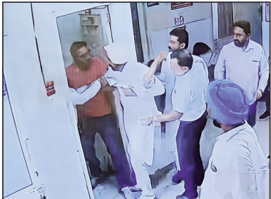
ਵਿਅਕਤੀ ਨੂੰ ਕਾਬੂ ਕਰਦੇ ਹੋਏ ਡਾਕਟਰ ਅਤੇ ਸਟਾਫ਼

ਡਾਕਟਰਾਂ ਨੇ ਮੌਕੇ 'ਤੇ ਕਾਬੂ ਕੀਤਾ, ਗੁਪਤ ਅੰਗ ਤੇ ਟੋਪ ਨਾਲ ਲਾ ਕੇ ਲਿਆਇਆ ਸੀ ਸਰਿੰਜ