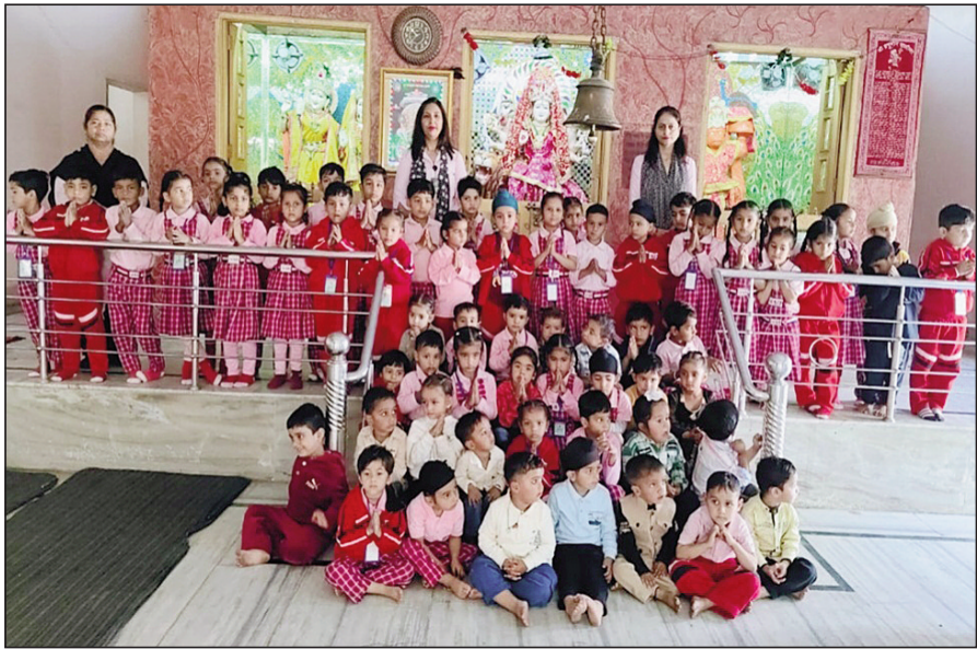
ਤਪਾ ਮੰਡੀ, 07 ਮਾਰਚ (ਬੰਟੀ ਦੀਕਸ਼ਿਤ, ਮੇਸੀ ਤਪਾ): ਸਬਾਨਕ ਸ਼ਿਵਾਲਿਕ ਪਬਲਿਕ ਸਕੂਲ ਤਪਾ ਵਿੱਚ ਪ੍ਰੀ-ਪ੍ਰਾਇਮਰੀ ਵਿੱਚ ਦੋ ਫਰਵਰੀ ਅਤੇ

ਮਾਰਚ ਮਹੀਨੇ ਵਿੱਚ ਜਨਮੇ ਵਿਦਿਆਰਥੀਆਂ ਦਾ ਜਨਮਦਿਨ ਕੇਕ ਕੱਟ ਕੇ ਅਤੇ ਸਰਾਂ ਮੰਦਰ ਦੇ ਦੌਰੇ ਨਾਲ ਮਨਾਇਆ, ਜਿਸ ਨਾਲ ਵਿਦਿਆਰਥੀਆਂ